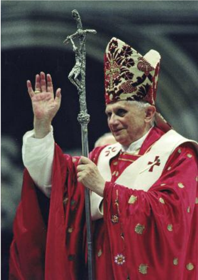
Papa Benedetto XVI